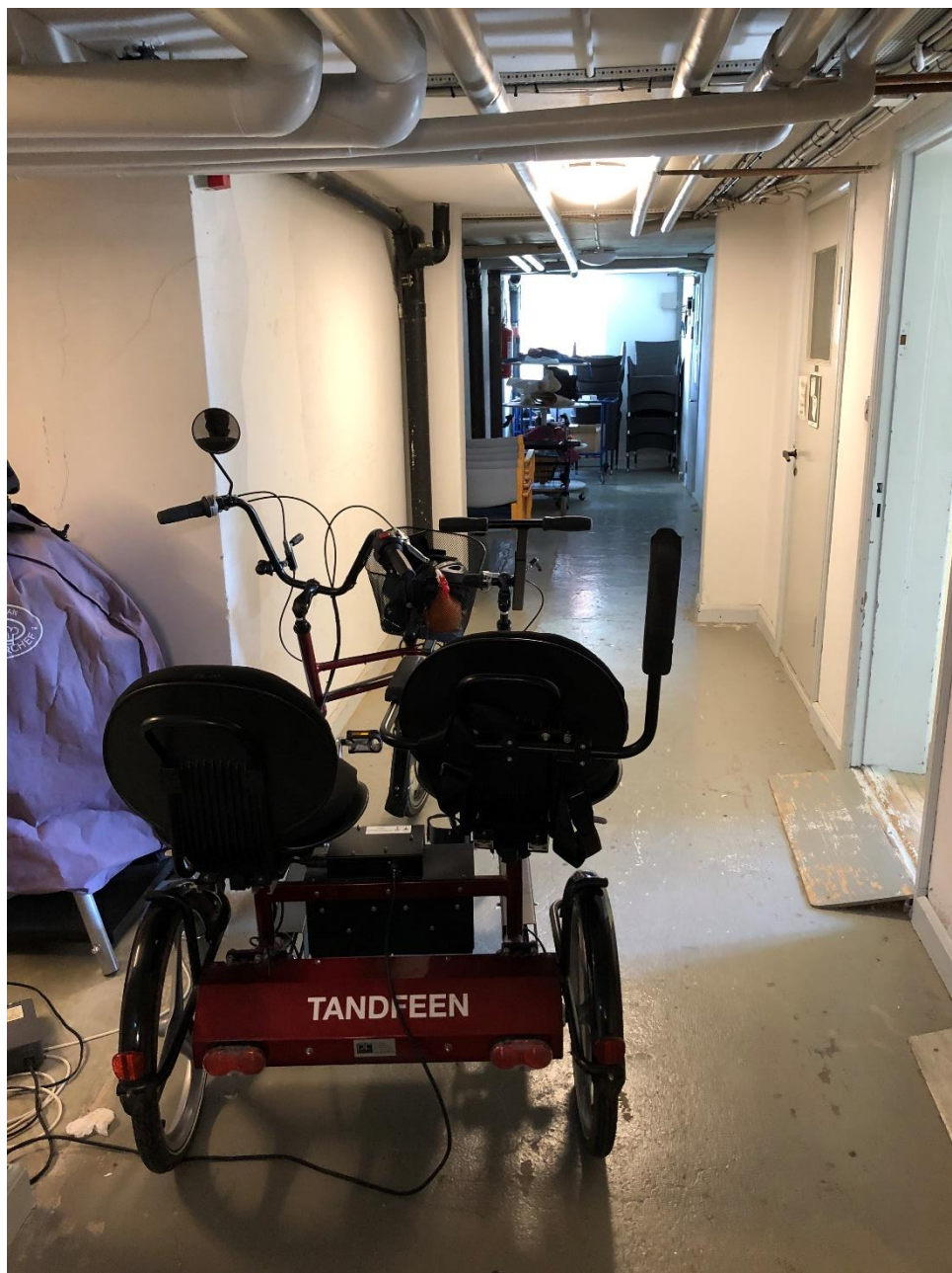
Figur 3 Oplag i kælder og opladning af køretøj

Gangarealer i kælder benyttes til oplag. Gangarealet skal friholdes for oplag. Desuden oplades køretøjer i gangarealet i kælderen.