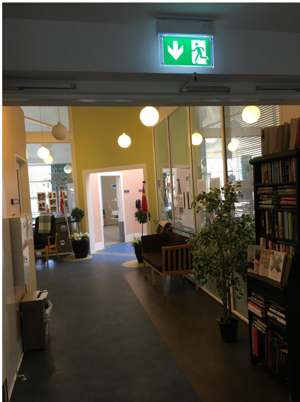
Figur 5: Oplag i flugtvejsgang

Jf. BR95 afsnit 6.5.1 stk. 1. skal flugtveje alene være indrettet til formål, som ikke medfører væsentlig brandbelastning eller reducerer gangens funktion som flugtveje jf.