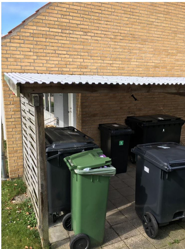
Figur 6 Affaldscontainer placeret ved åbning

Affaldscontainer opbevares op af bygningens ydermur hvor der er åbning. Affaldscontainerne skal placeres min. 5 meter fra åbningen eller åbningen lukkes med branddør klasse EI 2 60-C.