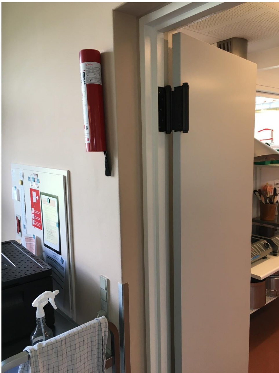
Figur 4 Uklassificeret dør mellem køkken og opholdsstue

Manglende opdeling af opholdsstue og køkken, da der var anvendt uklassificeret dør som var i åben position uden ABDL. Døren skal være udført som EI 2 30-C [BD-dør 30], og udført med ABDL.