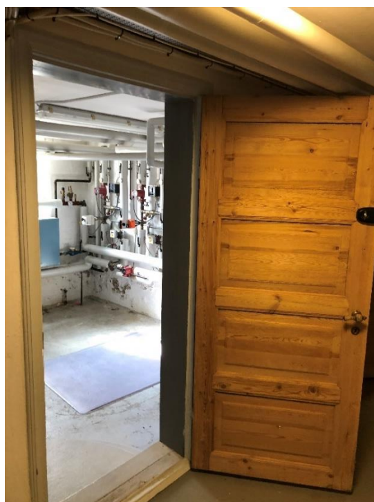
Figur 2 Dør indtil fyrrum udført som uklassificeret trædør

Dette er som minimum gældende for fyrrummet.