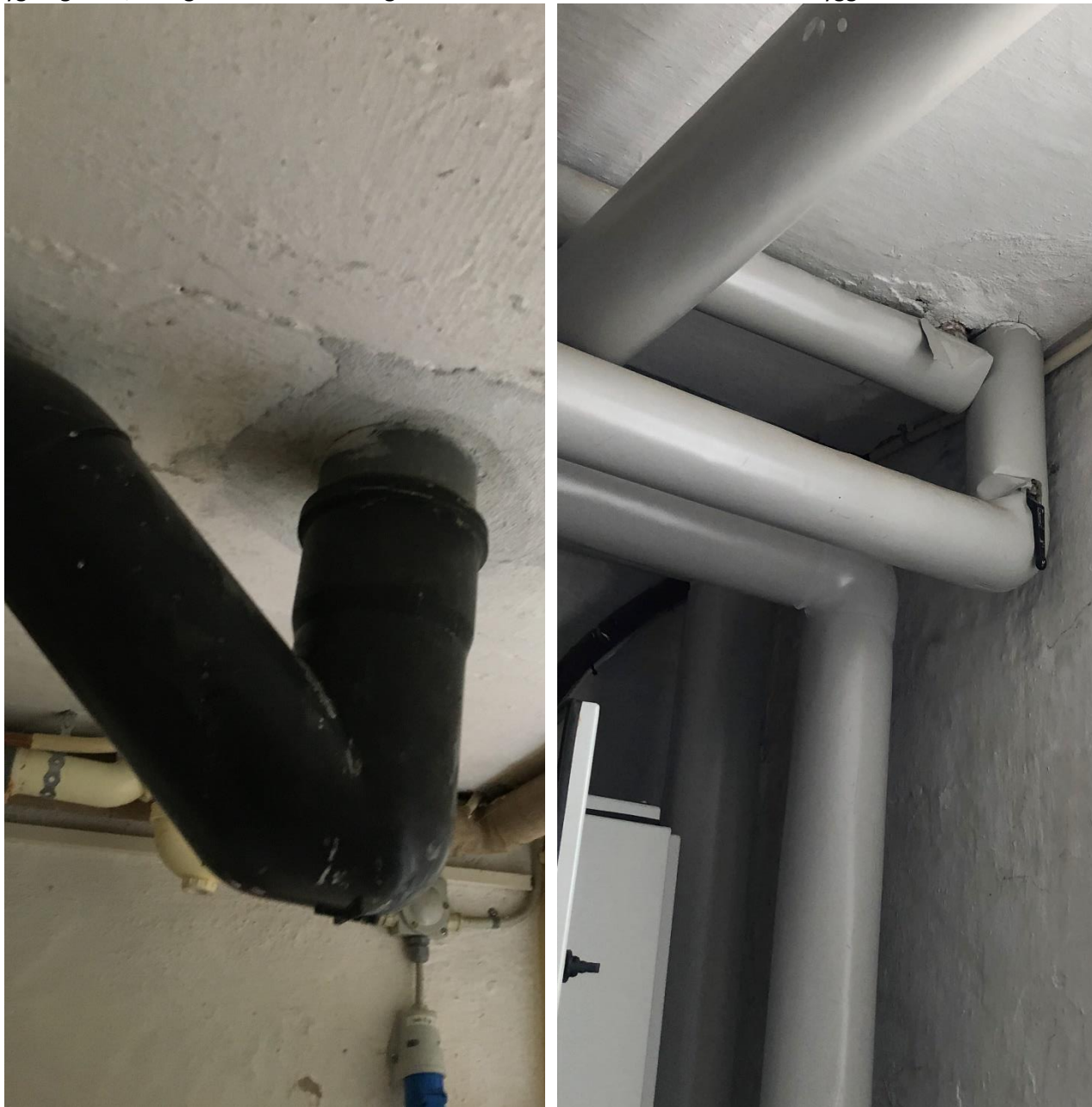
Figur 1: Manglende brandtætning ved installationsgennemføring

Herunder ses aktuelle eksempler på manglende brandtætning omkring gennemføringer i brandadskillende bygningsdele, manglende brandmæssig adskillelse mellem lokaler i det aktuelle byggeri.